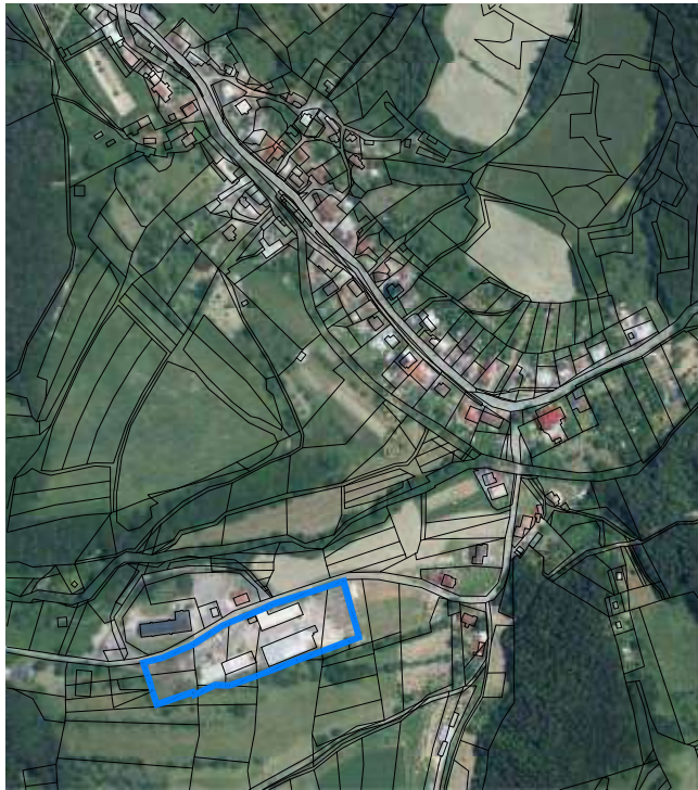
— UMÍSTĚNÍ PROVOZU DŘEVOVÝROBY V OBCI DRŽKOVA